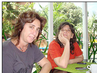
Directora y productora esperan que su participación en la Berlinale impacte sobre el cine de Venezuela.

"En este caso lo que buscábamos era un chico de 12 años que ni siquiera hubiera hecho de Peter Pan en la escuela, nada".